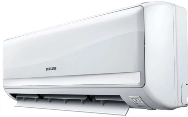
جهاز تكييف ٢٠٠٠ ا.و.ب