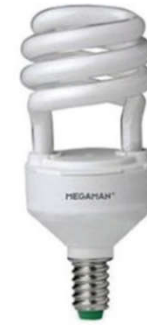
لمبة موفرة ٢٠ وات

استخدام اللمبات المدمجة الموفرة للطاقة تساعد في تخفيض عدد ساعات تشغيل ضاغط جهاز التكييف لان الحرارة المنبعثة منها أقل كثيرا من تلك المنبعثة في حالة استخدام اللمبات العادية